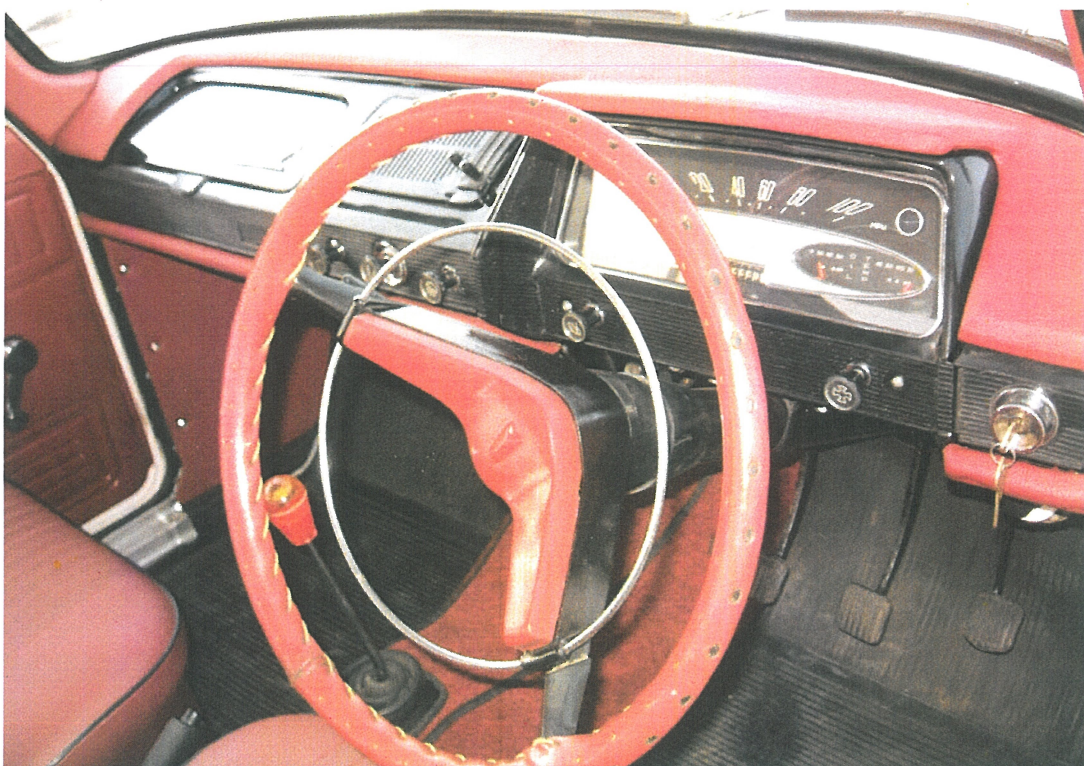
Vaade sõiduki armatuurlauale ja juhtimisseadmetele