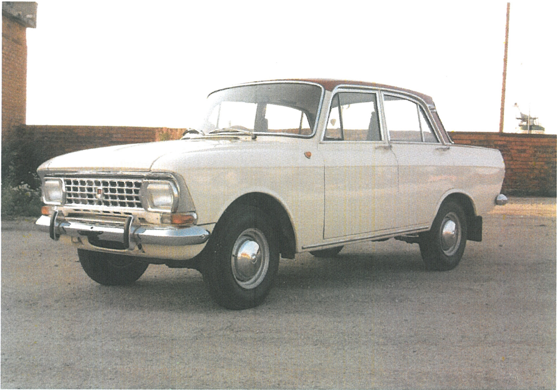
Diagonaalvaade esiosale ja vasakule küljele