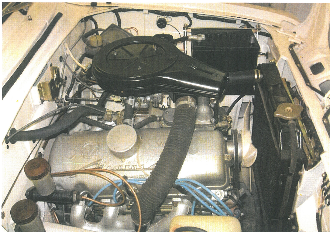
Vaade mootoriruumile vastassuunast