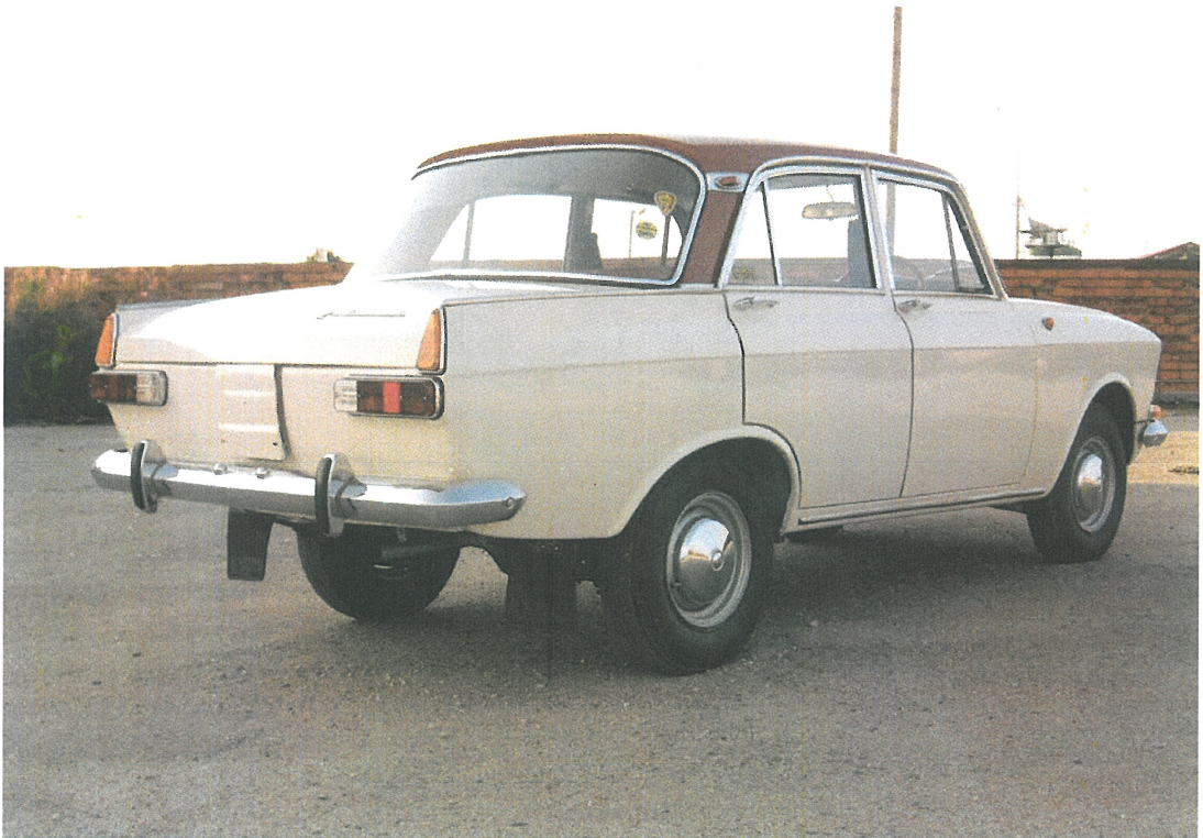
Diagonaalvaade tagaosale ja paremale küljele