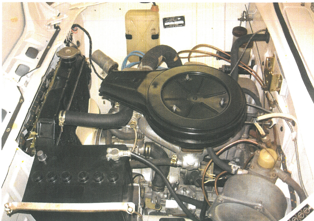
Vaade mootoriruumile vasakult või sõltuvalt mootoriruumi katte paigutusest muust suunast